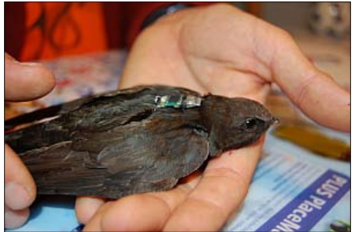
De foto toont een gierzwaluw met de kleine geolocator op de rug bevestigd, in de handen van Raymond Klaassen.

vogels drastisch kan veranderen. Ook die over het onverwachte gebruik van een beperkt aantal geografische gebieden tijdens de trek. Dit kan belangrijke consequenties hebben voor beschermingsplannen waarbij trekvogels gebaat zijn.