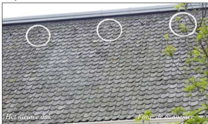
Het nieuwe dak